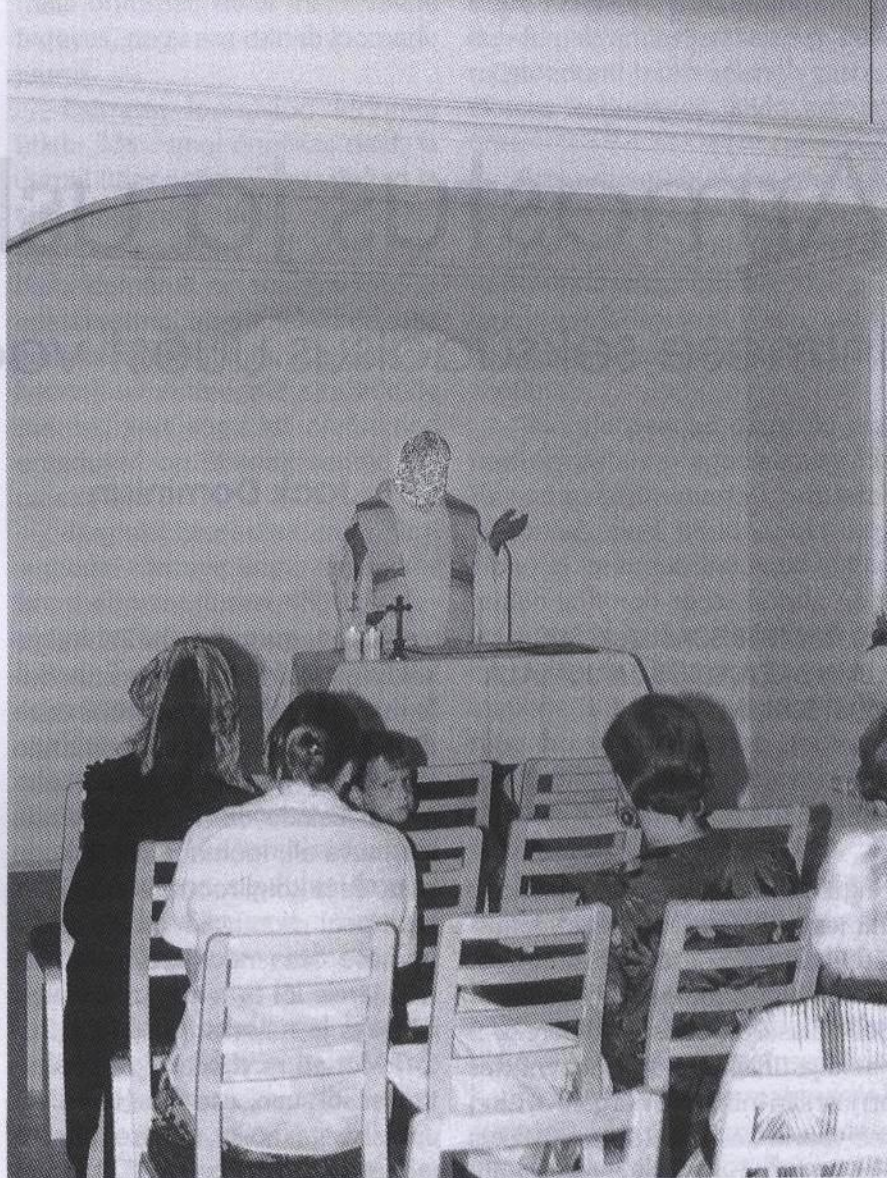
Pildil: Esimene missa Pärnu uues kabelis. Preestri isik tundmatu.

ne ümberehitamine on keelatud. Kuna hoone elementaarnegi kordategemine läinuks kallimaks kui uue hoone ehitamine, otsustasime kompensatsiooni kasuks. Selle raha eest saame välja osta teise maja krundi.