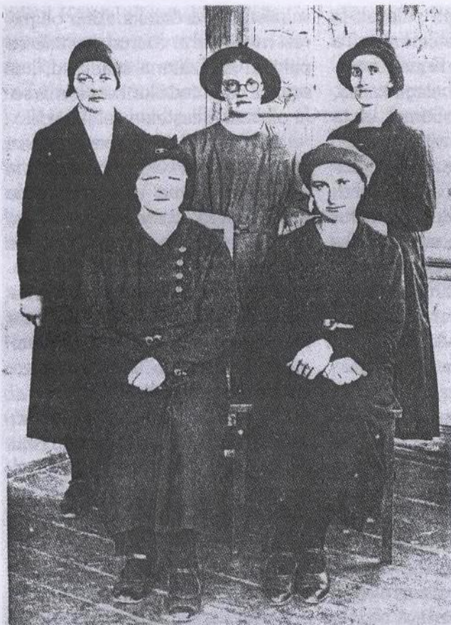
Esimest korda aastate järel jälle tsiviilriietes

äratada. Oli kurb, kui pidime pealt vaatama, kuidas purustati Possieti tänavas asuv altar ja määrati ärapõletamisele. Ma ei tea, mida tehti ülejäänud jumalateenistusliku inventariga ja missarütidega. Ka auväärne isa pidi silmapilkselt sealt ära kolima ja ta tohtis kaasa võtta ainult isiklikud esemed, kõik muu konfiskeeriti. Tal oli ka palju raamatuid, milledest ta ei tahtnud ilma jääda. Ta ei tahtnud mitte kedagi oma ettevõtmisese pühendada, ja nõnda meie, kui oli läinud pimedaks, aitasime tal kelguga raamatuid meiepoole kolidada. Me kandsime juba tsiviilriideid, nii et me ei torganud silma.