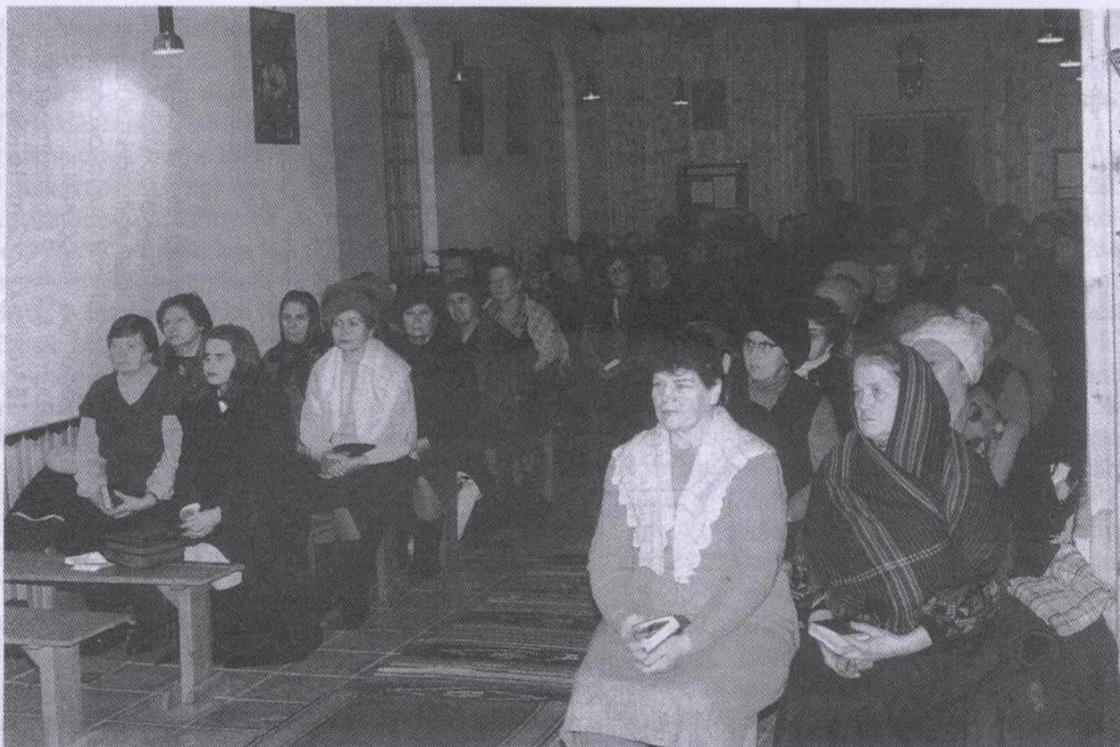
Reisijatel palun kinnitada võõrihmad ja lõpetada suitsetamine ...

aastas oma kodupaiku Valgevenes, kus hoiti kontakti ka kirikuga, käidi pihil ja Armulaua, ristiti lapsed. Paljud olid siiski käinud oma lapsi ristimas ka Tallinnas.