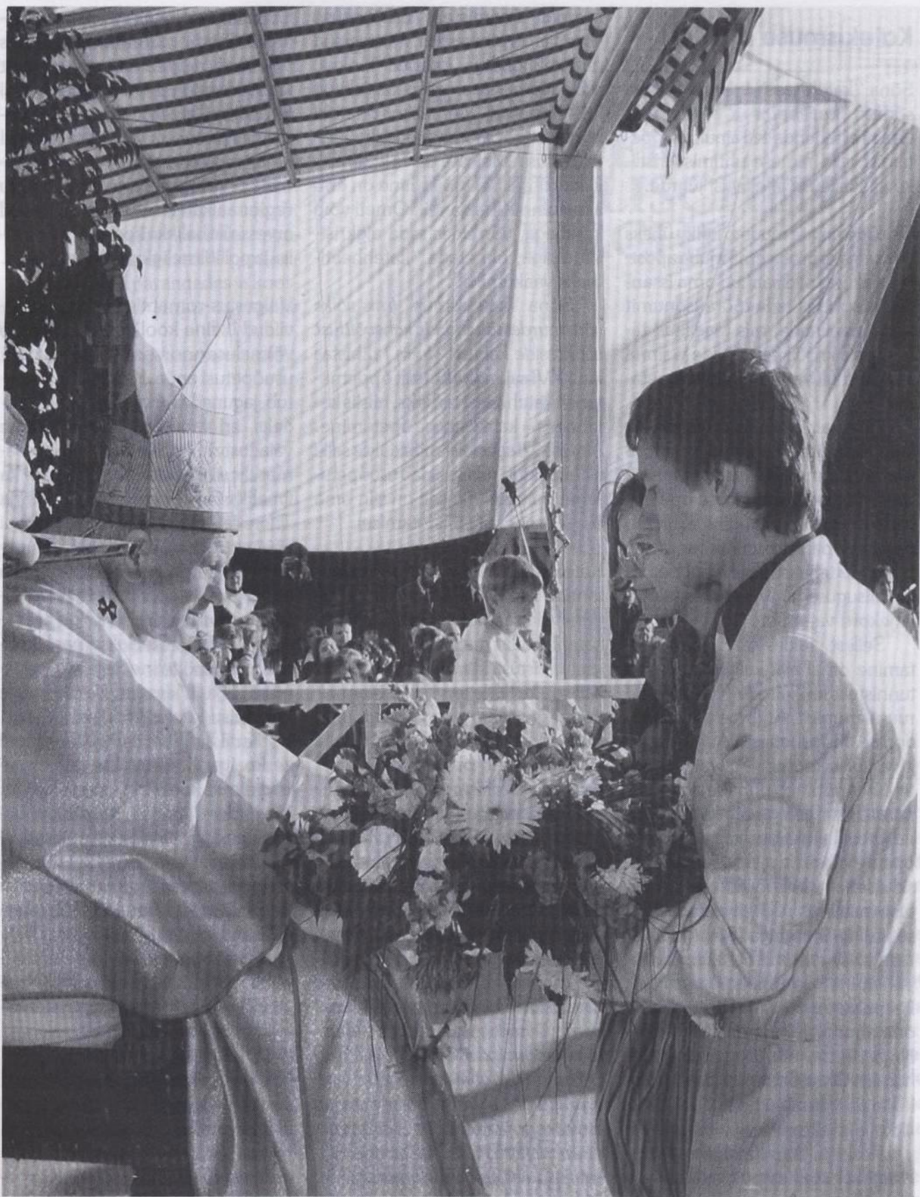
□ Hetk paavstimissalt Tallinna Raekoja platsil 10.9.1993. Eesti katoliku koguduste ilmikesindajad toovad paavstile kogudustepoolseid kingitusi.