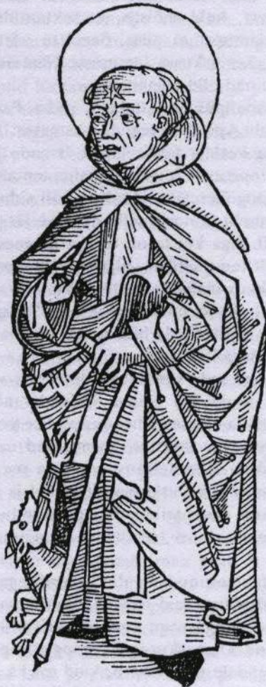
Püha Franciscus ja püha Dominicus. "Nürnbergi kroonika" aastast 1493.