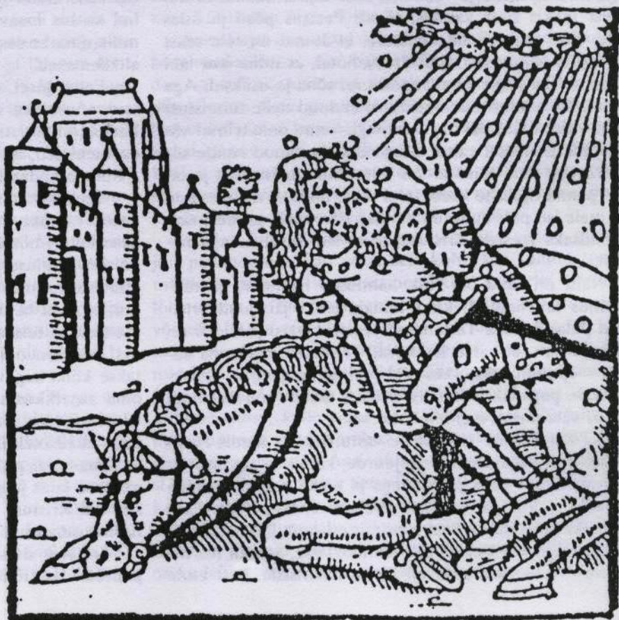
Issanda ilmumine Saulusele. Gravüür alamsaksa "Dat Passio- nael'ist" (versioon "Legenda Aurea'st") aastast 1492.

See kirjakoht seletab ehk kõige paremini, miks nimetab Kirik Paulust rahvaste apostliks, ehkki pärast teda tunneb ajalugu paljusid pühakuid, kes tegid pikemaid misjonirännakuid kui tema ja kirjutasid rohkem usulise sisuga raamatuid enamates keeltes.